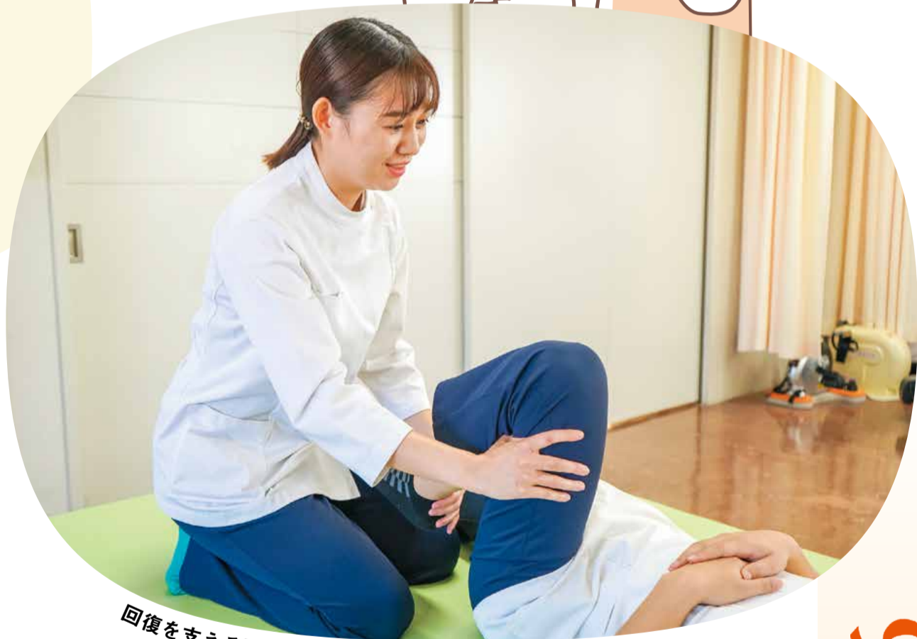
回復を支える医療と当院のリハビリについて