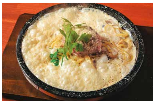
▲黒毛和牛100%！激レアハンバーグのポロネーゼ〜クリームソース〜

メニューを選ぶ楽しさも感じていただきたく、40種類以上のメニューをご用意しています！中でも人気の「黒毛和牛100%！激レアハンバーグのポロネーゼ〜クリームソース〜」。数量限定で、これを目当てに来店される方も多く、見た目も量もインパクト抜群です！ また料理へのこだわりはもちろんです。お店自体の雰囲気も大切に、明るく笑顔あふれる接客を心掛けています！