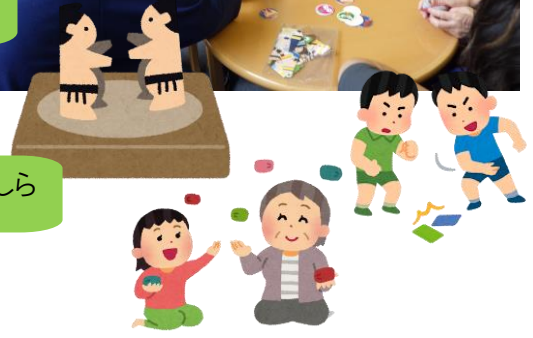
何十年ぶりかしら